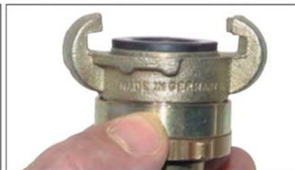
Joint d'étanchéité pré- vissé - la connexion est étanche.