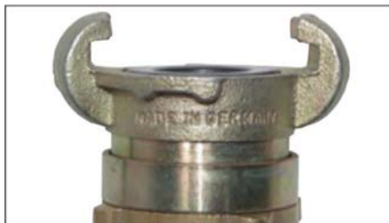
Joint à rotation inverse - accouplement facile possible